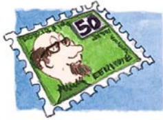
a. Briefmarke .....

☉ Telefon ☉ Hammer ☉ Fotoapparat ☉ Batterie ☉ ☉ Gabel ☉ Kerze ☉ Film ☉ Strumpf ☉ Feuerzeug ☉ ☉ Nagel ☉ Ansichtskarte ☉ Messer ☉ Deckel ☉ ☉ Telefonbuch ☉ Schuh ☉ Briefmarke ☉ Topf ☉ Küchenuhr ☉