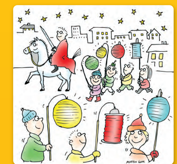
11. November | Sankt Martin