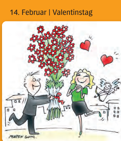
14. Februar | Valentinstag