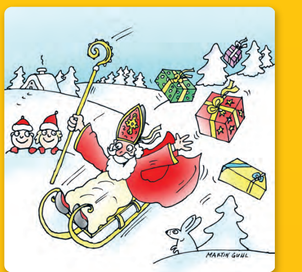
6. Dezember | Nikolaustag

Nähere Informationen und Materialien zu den Feiertagen und andere landeskundliche Themen finden Sie in der Rubrik „Landeskunde“ unter www.hueber.de/daf