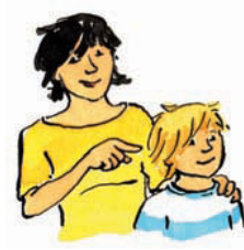
er er Pronomen