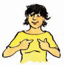
ich ich Pronomen