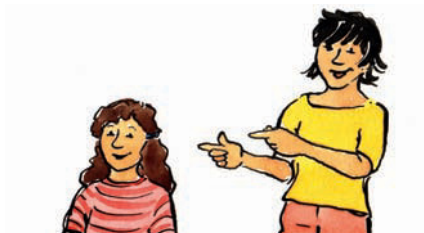
sie sie Pronomen