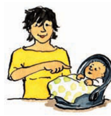
es es Pronomen