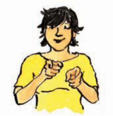
du du Pronomen