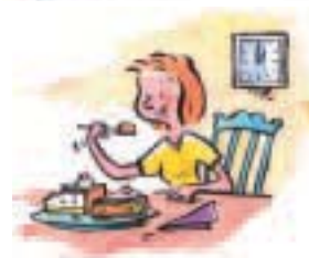
viel Kuchen essen