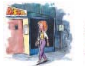
in die Disko gehen