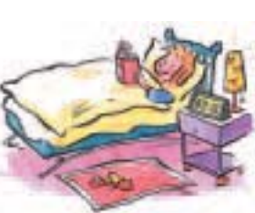
bis 2 Uhr lesen