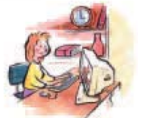
vor dem Computer sitzen