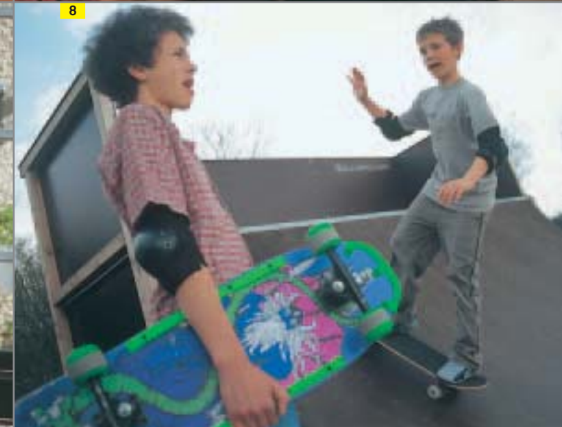
FOLGE 8: WOLFGANG AMADEUS ODER: WICHTIGERE DINGE