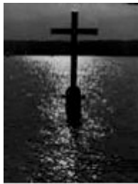
Gedenkstätte am Starnberger See

Und Ludwig? Er spielt seine einsame Rolle immer besser. Er fährt im Winter nächtelang auf einem vergoldeten Schlitten durchs Land. Er schläft in vergoldeten Betten und reist in vergoldeten Kutschen. Das einfache Volk bewundert ihn. Aber den Mächtigen steht er im Weg. Sie wollen nicht mit ihm ins Mittelalter zurück. Sie wollen einen König mit Verständnis für Fortschritt und Industrie.