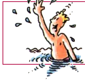
Moritz, 13 Jahre