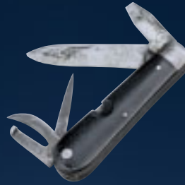
Das Soldatenmesser aus dem Jahr 1891