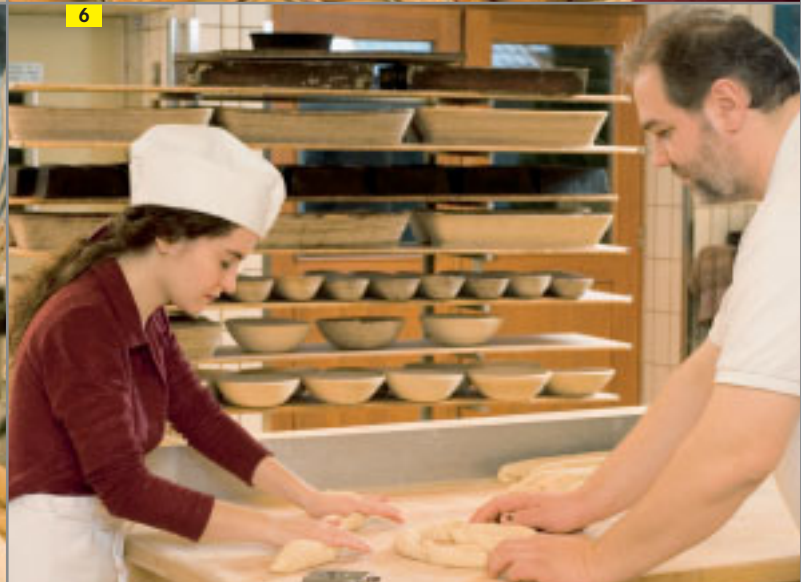
FOLGE 4: BACKEN MACHT MÜDE