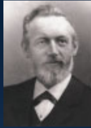
Karl Elsener (1860 – 1918)