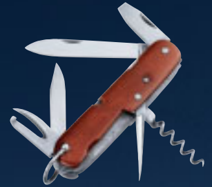
Das Schweizer „Offiziersmesser“ von 1897

Wenn Sie Brot schneiden, eine Dose Fisch und eine Flasche Wein aufmachen möchten, dann können Sie natürlich ein Messer, einen Dosenöffner und einen Korkenzieher suchen. Oder Sie holen einfach Ihr Ding aus der Tasche.