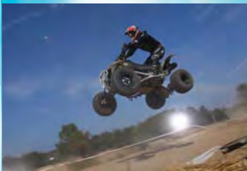
Mit dem Quad