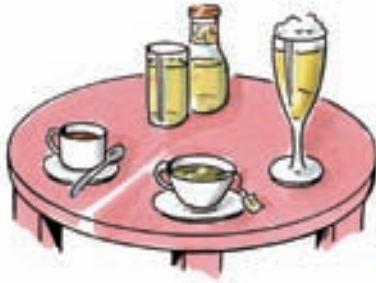
Table n° 1