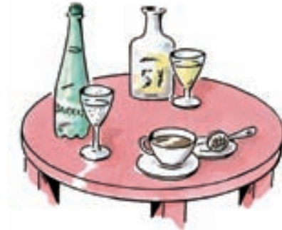
Table n° 2