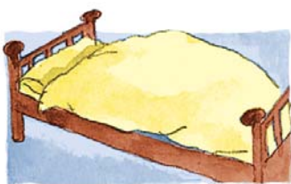
a. das Bett