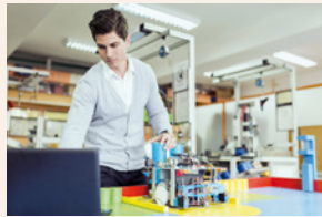
der Physikraum .....