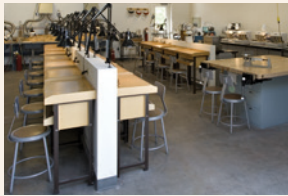
der Werkraum .....