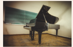
der Musikkraum .....