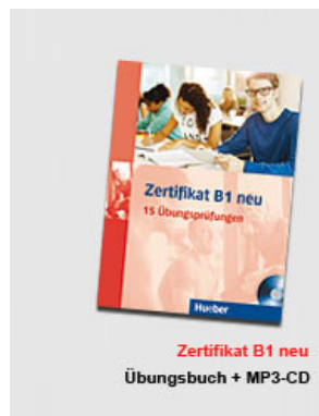
Zertifikat B1 neu Übungsbuch + MP3-CD