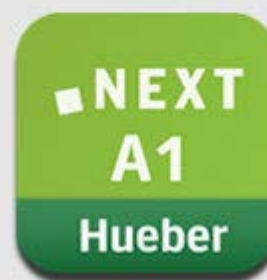
Next A1 Listen & Speak App