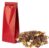
Beutel; Tee