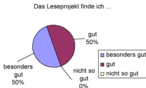
Abb. 4: Einschätzung des Leseprojekts

Genau die Hälfte der Schüler fand das Leseprojekt „besonders gut“. Die andere Hälfte bewertete das Projekt mit „gut“, wie die Graphik zeigt (s. Abb. 4).