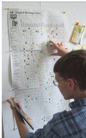
Abb. 2: Reading chart

Manche Schüler erfanden Zwischenkategorien, indem sie beispielsweise grün/rote Punkte vergaben. Auf meine Nachfrage hin konnten einige Schüler diese Entscheidung auch detailliert und überzeugend begründen. Mit diesen Bewertungen gaben die Schüler ihre Leseindrücke für alle anderen Teilnehmer am Leseprojekt sichtbar wieder. So können sowohl Mitschüler als auch Lehrer auf die Einschätzungen zurückgreifen. Sobald ein Kind seine Leserbewertung abgegeben hatte, konnte das Buch an einen Klassenkameraden weitergegeben werden. Drittens wurde auf dem reading chart mit Smiley-Aufklebern vermerkt, welches Kind den Test zu welchem Buch bestanden hat.