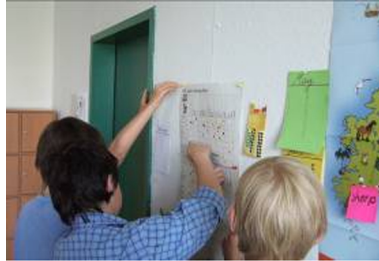
Abb. 3: Gestaltung von reading charts

(Anzahl der bunten Punkte) als auch die ganz persönliche Einschätzung des Lesestoffs (Farbe der Punkte) und der Testerfolg (Smiley-Aufkleber) der einzelnen Schüler für alle Beteiligten schnell einsehbar (s. Abb. 3). Diese Transparenz bot den Schülern einen starken Anreiz zur Auseinandersetzung über die gelesenen Bücher und über den Leseerfolg. Bereits nach kurzer Zeit entstand ein Wettbewerb zwischen den Schülern, wer die meisten Bücher gelesen und welcher Schüler bei den Tests am besten angeschnitten hat.