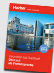
Programm DaF 2015