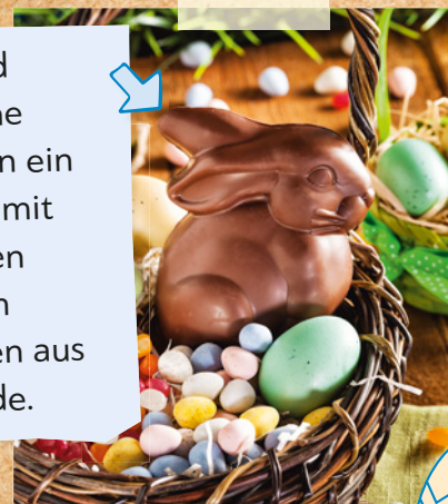
Kinder und Erwachsene bekommen ein Osternest mit Süßigkeiten und einem Osterhasen aus Schokolade.