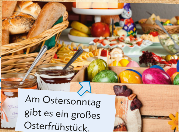
Am Ostersonntag gibt es ein großes Osterfrühstück.