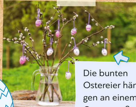
Die bunten Ostereier hängen an einem Osterstrauß.