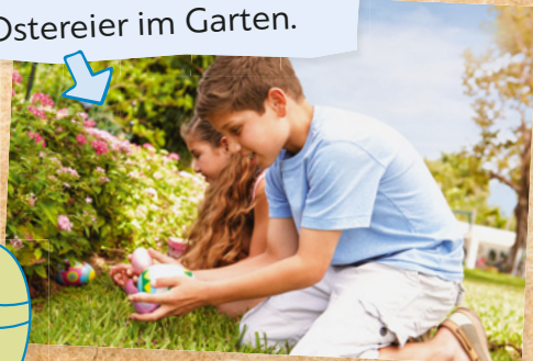
Die Kinder suchen Ostereier im Garten.