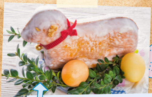
Das Osterlamm aus Kuchen isst die Familie am Ostersonntag.