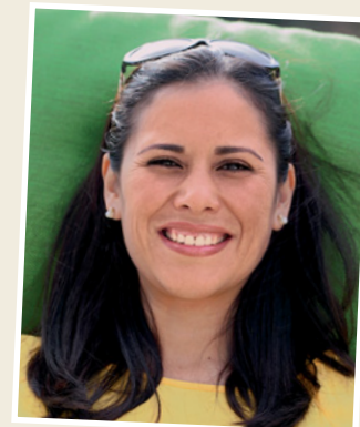
Foto | Lebenslauf | Besuch im Personalbüro | Anschreiben | Telefonat mit der Firma | Bekannte über die Firma befragen | Zeugnisse und Bescheinigungen | im Internet recherchieren

2 ..... Was gehört Ihrer Meinung nach zu einer Bewerbung? Sprechen Sie.