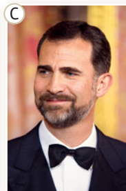
Prinz Felipe, Spanien