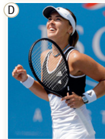
Martina Hingis, Schweiz