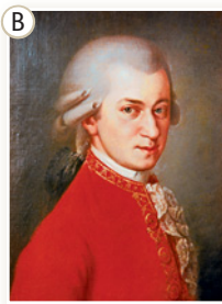
Wolfgang Amadeus Mozart, Österreich