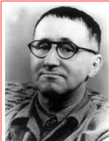
Bertolt Brecht