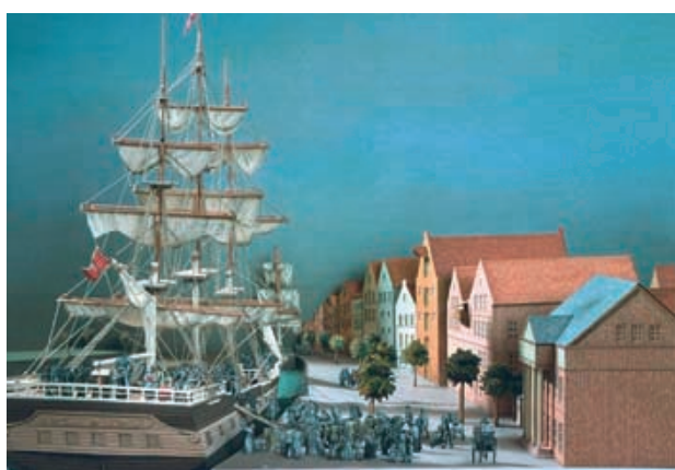
„Einschiffung im Alten Hafen“, um 1850

Schwarzkopf, Kissinger, Bremer, Eisenhower – warum haben viele Amerikaner einen deutsch klingenden Namen? Wir müssen etwa 200 Jahre zurückblicken, um eine Antwort auf diese Frage zu bekommen.