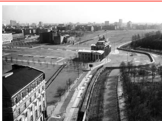
Brandenburger Tor 1976

Mit 60.000 Selbstschussanlagen 16 und vielen Tretminen 17 wurde die innerdeutsche Grenze 18 in den folgenden Jahren immer weiter „perfektioniert“. Dadurch wurde die Zahl der Flüchtlinge von Jahr zu Jahr kleiner. 1964 waren es noch über 3.000, 1985 nur noch 160 Personen.