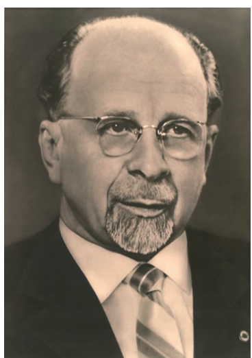
Walter Ulbricht

„Niemand hat die Absicht, eine Mauer zu bauen!“ Diesen Satz sagte Walter Ulbricht, der Staats- und Parteichef 12 der Deutschen Demokratischen Republik (DDR). Nur wenige Tage später, am 13. August 1961, begann der Bau der Berliner Mauer und des Grenzzauns 13 zwischen der DDR und der Bundesrepublik Deutschland.