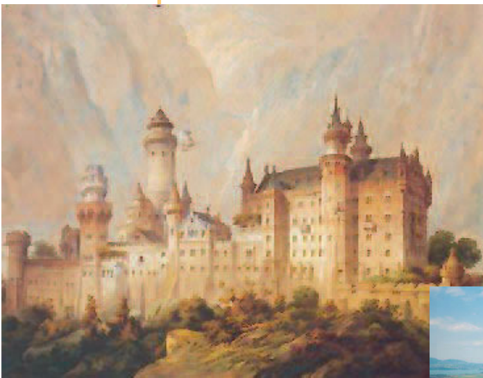
Idealentwurf zu Schloss Neuschwanstein von Christian Jank, 1869.