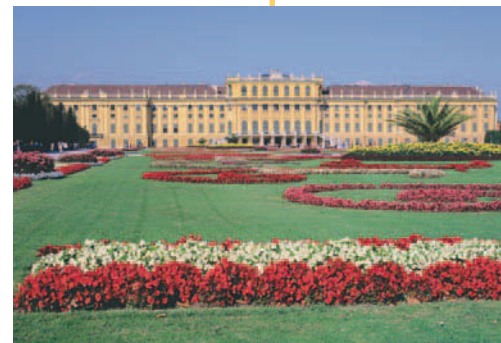
Schloß Schönbrunn: Gartenfront.

Fast jeder, der schon in Wien war, kennt es. Mit seinen 1441 Zimmern ist Schönbrunn eines der ganz großen Schlösser in Europa. Bis 1918 hat es den Habsburgern gehört, die Jahrhunderte lang eine der mächtigsten Familien der Welt waren. 1696 hat man unter Kaiser Leopold I. mit dem Bau begonnen. Etwa 50 Jahre später, unter der Kaiserin Maria Theresia, war das Schloss fertig. Etwa 1820 hat es sein heutiges Aussehen und die Farbe, das typische „Schönbrunner Gelb“ bekommen.