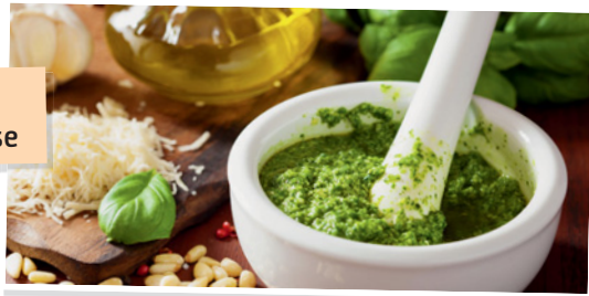
La ricetta del pesto genovese