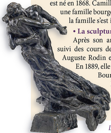
La Valse, musée Rodin

Elle a vécu et travaillé dans cet atelier pendant 24 ans, de 25 à 49 ans.